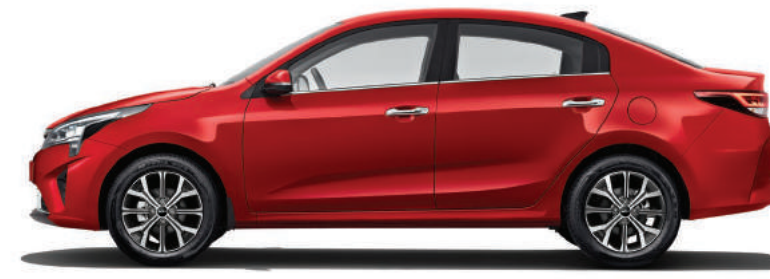
2 600 мм