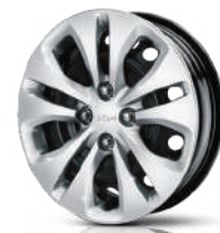
Стальные 15" диски