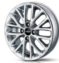
Легкосплавные 15" диски