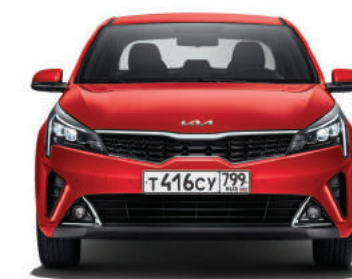
1 740 мм