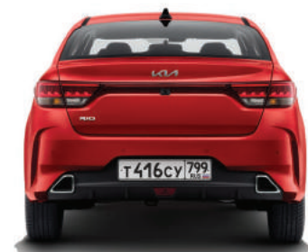
1 470 мм