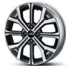
Легкосплавные 16" диски

Остановитесь. Подумайте. Это важный, определяющий момент. Выберите цвет кузова и исполнение Kia Rio, в котором предлагается отделка салона, диски и опции, которые Вы бы хотели. Выберите настроение на каждый день своей жизни. Выберите то, что вызывает отклик в душе. С Kia Rio это так просто!