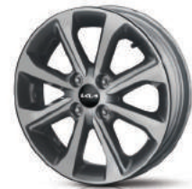
Темные легкосплавные 15" диски